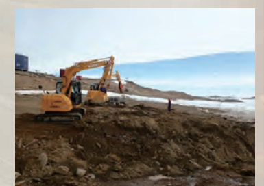
汚染拡散防止対策