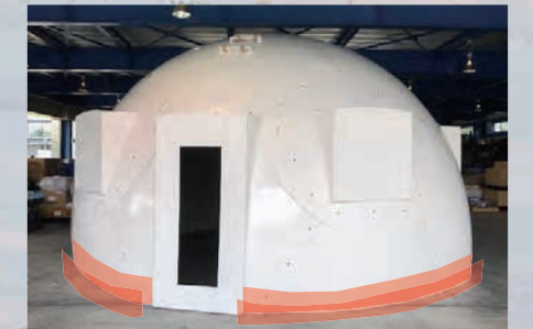
*国内で仮組したレドーム

また、樹脂ボルトによってFRPパネルを接合するとともに、パネル同士を接着剤で固定し、パネル端をシリコンで埋めて風雪対策を行ないます。