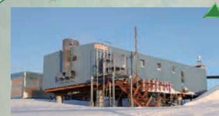
環境科学棟（1974年建設）