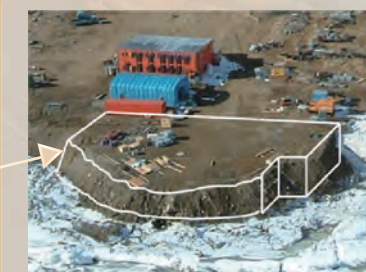
廃棄物埋立地エリア

62次隊では、61次隊までの作業を継続し、過去の廃棄物埋立地の汚染拡散防止対策と廃棄物の調査を行い、作業中に掘削された廃棄物を持ち帰る予定です。