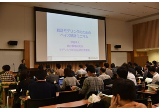
リーディングDAT講座開催時の様子