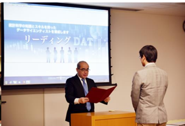
「養成コース」修了証交付式の様子